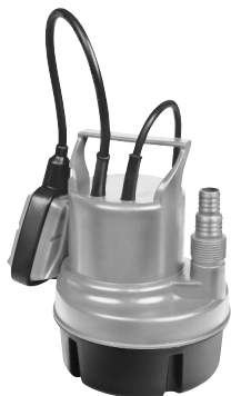
Serie AL 7993 X 410