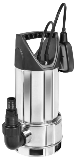
Serie AS 7993 X 415