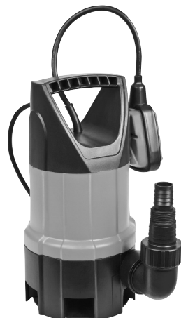
Serie AS 7993 X 412