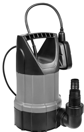
Serie AL 7993 X 411