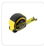
FLEXÓMETRO 10M STANLEY® FATMAX®