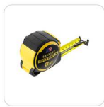
FLEXÓMETRO 8M STANLEY® FATMAX®