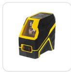
Nivel láser de líneas ROJAS en cruz STANLEY® FATMAX®