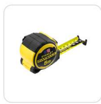
FLEXÓMETRO 5M STANLEY® FATMAX®