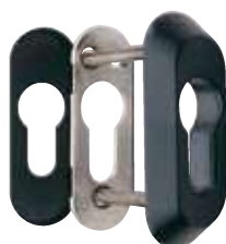
Detalle del escudo E210