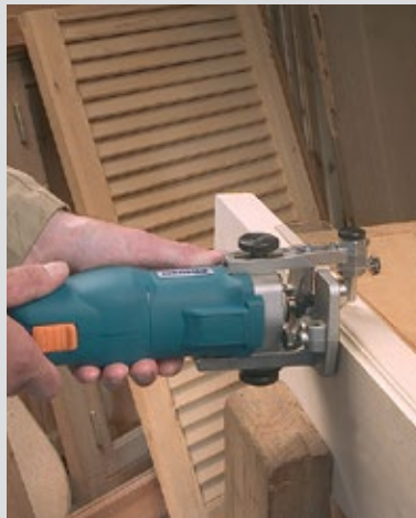
Realización de molduras.