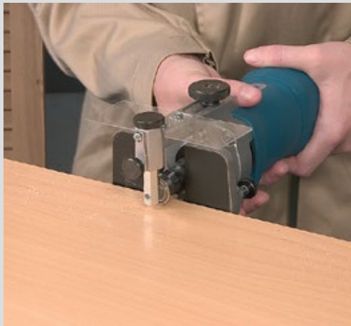
Excelentes acabados en el perfilado de estratificados.