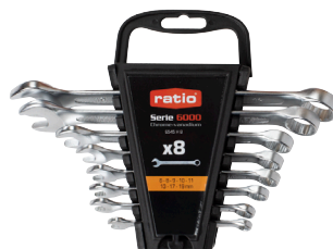
Juego 8 llaves en estuche plástico para colgar