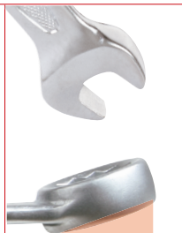
Cabezas anguladas 15°