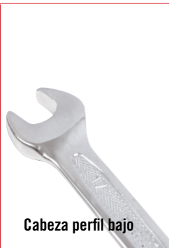
Cabeza perfil bajo