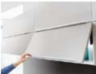
Apertura fácil y cómoda