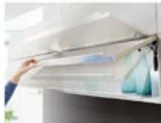
Cierre amortiguado Posicionable a cualquier ángulo