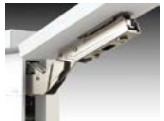
Regulación 3D de la puerta