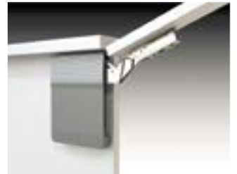
Ángulo de apertura 107°