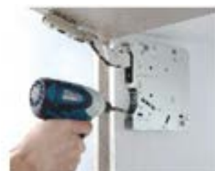
Velocidad de cierre regulable