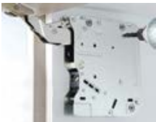
Velocidad de cierre regulable