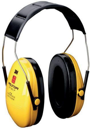
Orejera 3M Optime I H510A

• Anillo líquido de sellado en el interior de la almohadilla. Almohadillas amplias para reducir la sensación de presión.