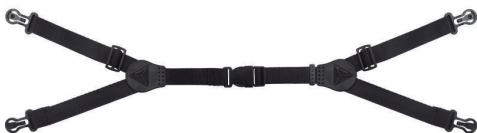
Barbuquejo para casco Onix