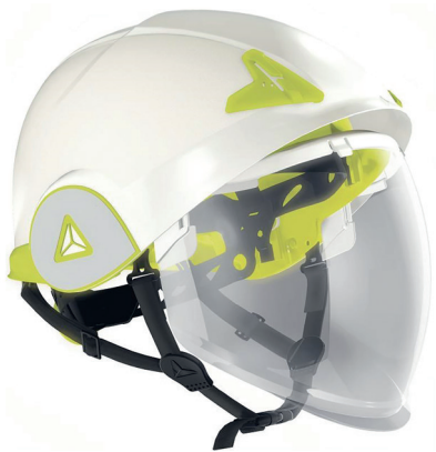
Casco Delta Plus Onyx