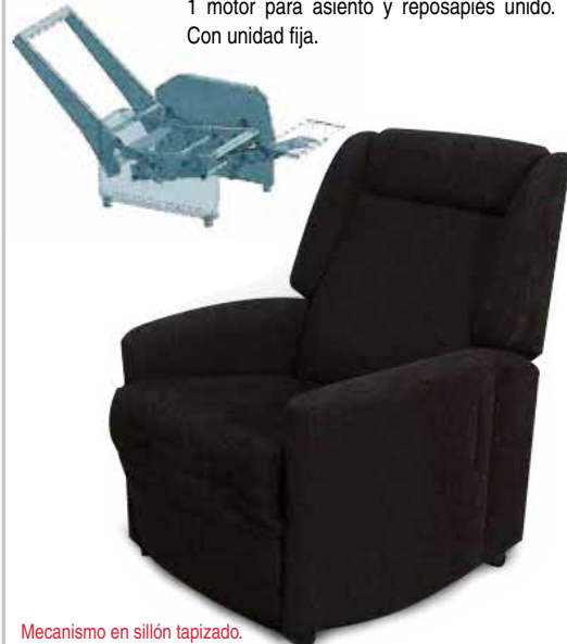
Mecanismo en sillón tapizado. Posición normal.

Mecanismo posición relax. Mecanismo con 1 motor para asiento y reposapiés unido. Con unidad fija.